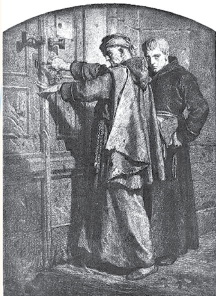
Zamknięcie kościołów, grafika Artura Grottgera z cyklu „Warszawa 1861”