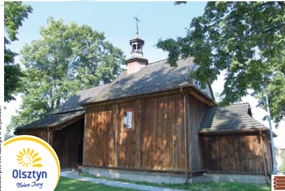
kościół pw. św. Idziego w Zrębicach