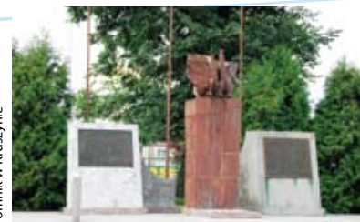
Pomnik w Kruszynie