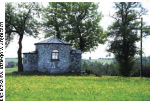
kapliczka św. Idziego w Zrębicach