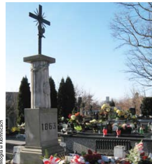
Mogiła w Kłomnicach